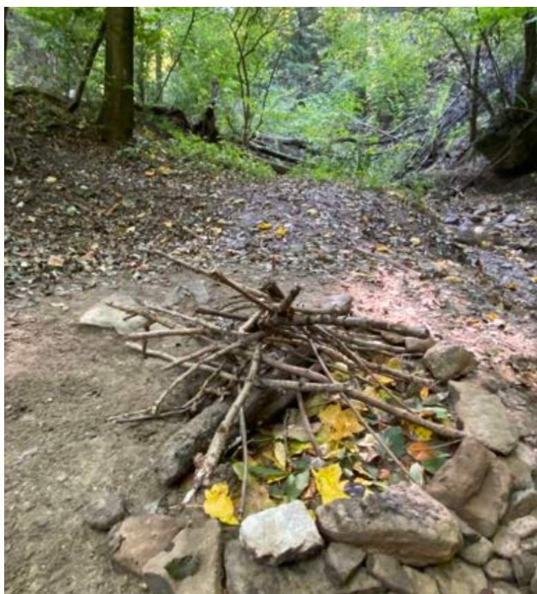
Kreiertes Landart von TeilnehmerInnen im Modul G